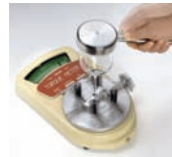
Prova resistenza stelo alla torsione Stem twisting test