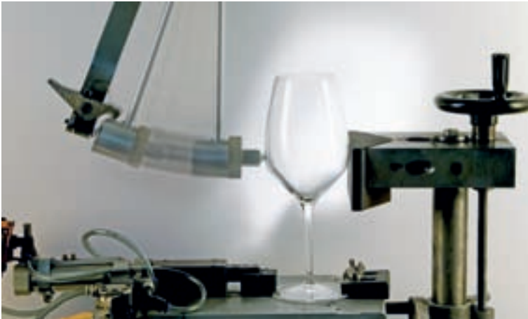
Prova resistenza urto coppa Bowl impact test